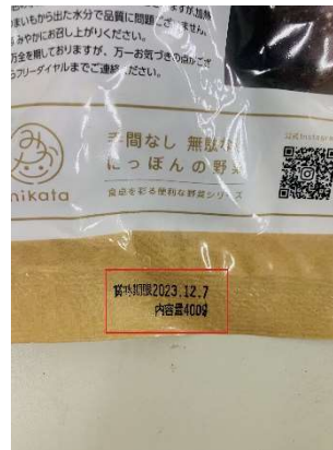
賞味期限印字箇所